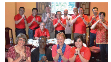
Groupe "Indo-Menno" avec des visiteurs de la CMM en février 2016.

Paroisses chrétiennes d'Indonésie fut créée en 1977 pour donner une structure ecclésiale aux services chrétiens exercés par la Fondation Sangkakala à Semarang. L'étendue du ministère englobe l'évangélisation, la distribution d'enregistrements de messages, les chants, les groupes musicaux, les services sociaux et plusieurs formations bibliques. Actuellement, il y a 223 paroisses dans le synode JKI et plus de 40 000 membres répartis dans 19 provinces indonésiennes ; il y a également quelques paroisses aux États-Unis, en Australie et aux Pays-Bas.