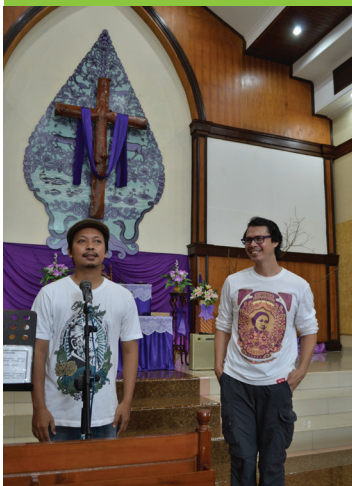
Pertemuan Terpisah

6 -11 Juli 2021 Temu Raya Holy Stadium, Semarang, Jawa Tengah, Indonesia Tema : Bersama-Sama Mengikuti Yesus Melintas Batas