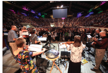
Penyembahan di Petang Hari

Setiap petang kita akan menikmati sajian musik dan pembicara dari satu benua setiap harinya.