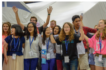
Acara untuk Remaja dan Pemuda

Setiap pagi akan ada beberapa pembicara yang telah dipilih oleh Komisi Kaum Muda Anabaptis dan salah satu anggota Komisi pada MWC. Kaum muda akan berperan aktif dalam mengatur acara di panggung. Pujian bersama akan menjadi bagian yang penting dalam acara ini sebagai bagian dari perayaan.