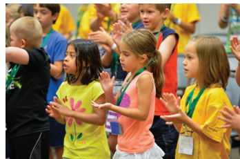
Acara untuk Anak-anak

Anak-anak akan bergabung dengan bersama dengan keluarganya di acara pujian pagi hari. Kemudian mereka akan terbagi dalam kelompok yang lebih kecil sesuai dengan kelompok umur. Acaranya meliputi : mendengarkan dongeng yang berkaitan dengan pesan Alkitab, kemudian ada permainan, kerajinan tangan, menyanyi bersama dan tentunya acara lain yang penuh dengan kegembiraan. Acara ini termasuk makan siang dan akan berakhir sebelum makan malam.