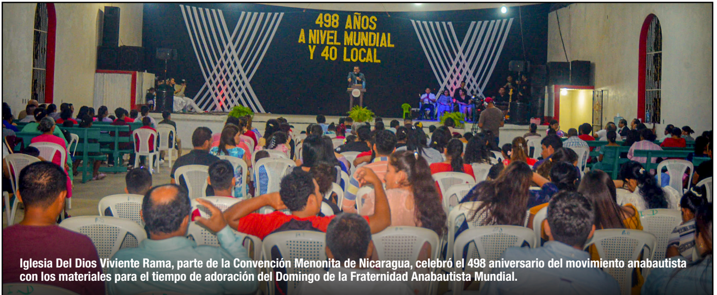
Iglesia Del Dios Viviente Rama, parte de la Convención Menonita de Nicaragua, celebró el 498 aniversario del movimiento anabautista con los materiales para el tiempo de adoración del Domingo de la Fraternidad Anabautista Mundial.