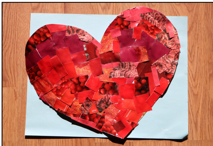
Este corazón de mosaico está conformado por muchas piezas pequeñas diferentes, al igual que la iglesia.