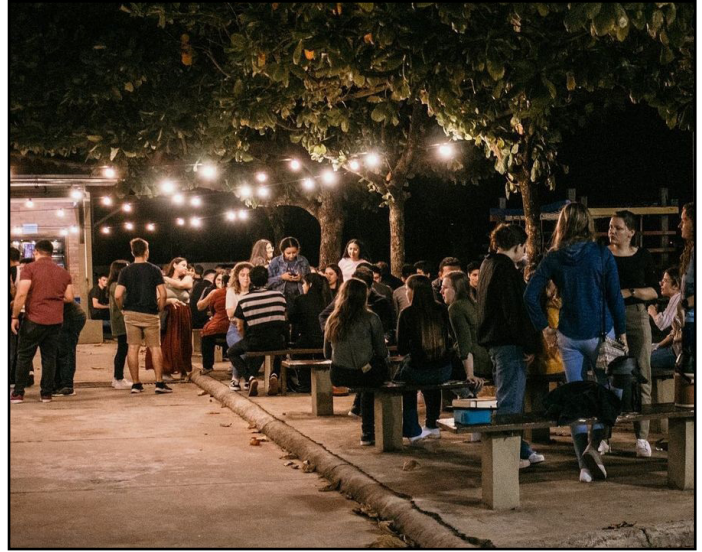
Iglesia Menonita Concordia