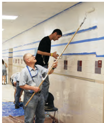
Oportunidades de servicio.

Las actividades por la tarde incluirán talleres, oportunidades de servicio, excursiones locales, deportes, la Aldea de la Iglesia Mundial y la Copa Mundial Anabautista.