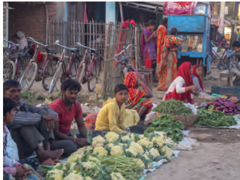
“Servicios de Ayuda Social de los Hermanos en Comunidad” ayuda a los agricultores mediante proyectos de seguridad alimentaria y programas de formación vocacional.

Servir a la comunidad que está desamparada y oprimida ha sido parte de la misión de la Iglesia BIC de Nepal desde que se inscribió como Sociedad de Ayuda Social de los Hermanos en Comunidad (BICWS). Servimos