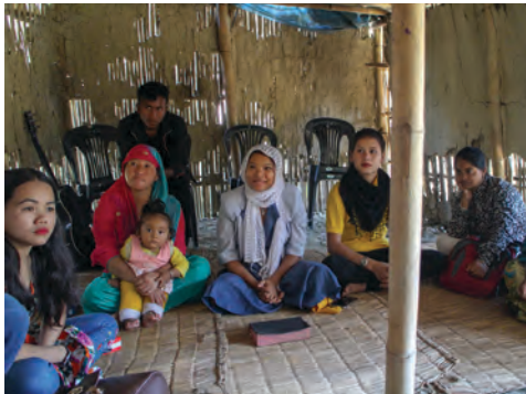
El edificio de barro de la iglesia BIC en el distrito de Itahari Sunsari se vio afectado por las inundaciones.