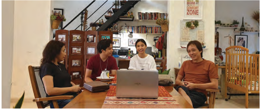
Miembros de la congregación Gloria Patri GKMI de Semarang, Indonesia, miran el culto en línea de su iglesia durante la pandemia del Covid-19.