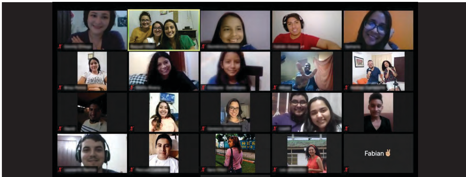
Como muchas iglesias durante la pandemia, los adultos jóvenes menonitas de Ecuador celebraron la Semana de la Fraternidad de YABs vía Zoom.