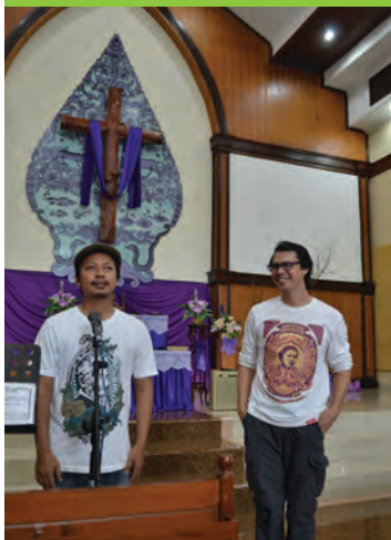
Asamblea Dispersa.

Seguir a Jesús juntos, superando las barreras