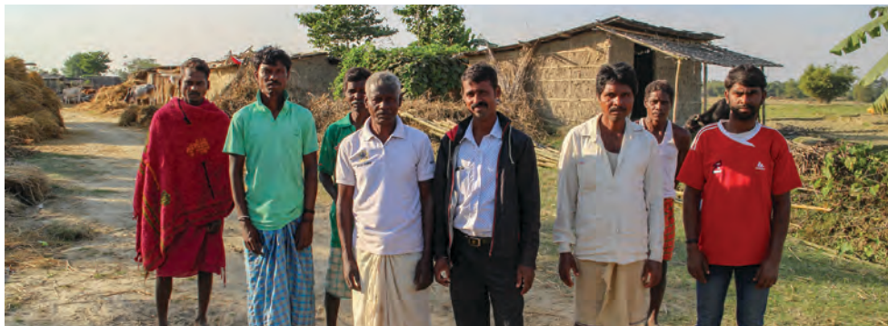
“Servicios de Ayuda Social de los Hermanos en Comunidad” ayuda a agricultores en el municipio rural de Jahada en el este de Nepal, mediante proyectos de seguridad alimentaria, programas de capacitación vocacional y educación rural.