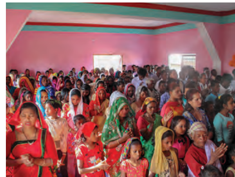
Los miembros de las iglesias BIC de Nepal tienen una fe viva, pese a la posibilidad de sufrir amenazas de grupos religiosos extremistas.

Como no existían disposiciones legales para inscribirse como iglesia, la Iglesia BIC de Nepal decidió organizar una rama social con el fin de servir a la comunidad para compartir el amor de Dios en acción. En nombre de la Sociedad de Ayuda Social de los Hermanos en Comunidad ( Brethren in Community Welfare Society , BICWS) de Nepal, se creó un fideicomiso social que se inscribió en