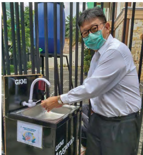
Gereja Kristen Muria Indonesia (GKMI) Anugerah, de Jakarta, Indonesia, instaló puestos de lavado de manos fuera de su iglesia.

“Nos vemos obligados a comprometernos a cumplir con las medidas que sean impuestas para el bienestar común y de esa manera, a través de una conducta ejemplar ante la sociedad, reflejar las enseñanzas de Cristo en el entorno en el que estemos. Como iglesia,