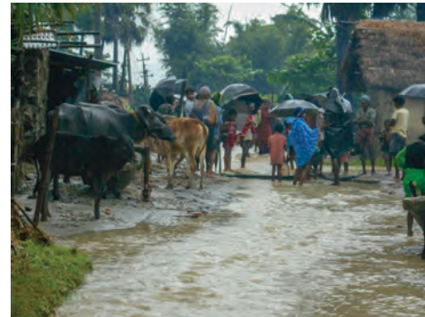
La zona central de llanura de Nepal, donde se concentra la mayoría de las iglesias BIC, sufre inundaciones frecuentes por el exceso de lluvias.

Incluso este año, durante el confinamiento