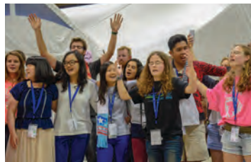
Programa para jóvenes.

Cada mañana se presentarán oradores elegidos por el Comité de Jóvenes Anabautistas y por una de las comisiones del CMM. Los jóvenes participarán activamente del programa en el escenario. Cantar juntos será una parte importante de nuestra celebración.