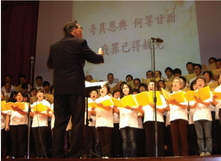
L'immense chorale de l'église mennonite de Hualien (Taiwan) a chanté pendant la célébration du 60 e anniversaire de la FOMCIT, en octobre 2014.