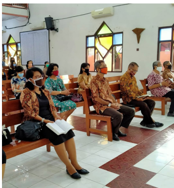
Culto con el distanciamiento social requerido en la GITJ Juwana, Indonesia.