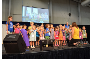
Programa infantil.

Los niños y niñas se unirán a los cantos matutinos junto con su familia. Luego, se les invitará a participar de un programa propio según su edad. El programa incluirá narración de historias en torno al mensaje bíblico, juegos, manualidades, cantos y muchísima diversión. El programa infantil ofrecerá un almuerzo y concluirá antes de la cena.