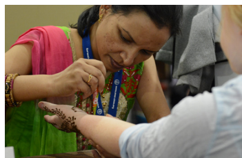
Programa de la tarde: Aldea de la Iglesia Mundial.