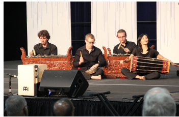
Programa matutino.

Cada mañana se presentarán oradores elegidos por el Comité de Jóvenes Anabautistas y por una de las comisiones del CMM. Los jóvenes participarán activamente del programa en el escenario. Cantar juntos será una parte importante de nuestra celebración.