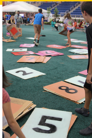
Juego con cartas gigantes entre adolescentes y jóvenes en 2015 PA, EE.UU.

Se centrará de modo especial en los jóvenes durante toda la Asamblea, lo cual incluirá pequeños grupos para jóvenes, presentaciones de oradores del Comité de Jóvenes Anabautistas, música inspiradora, oportunidades de servicio, temas relacionados con la juventud en los talleres, actividades deportivas y tiempo libre para compartir en la Aldea de la Iglesia Mundial. Y al final de cada jornada, por las noches, programa en las tardes.