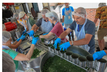
Opportunités de bénévolat.

Chaque après-midi est l'occasion d'apprendre, de partager et de se faire des amis. Nous avons prévu de nombreuses visites guidées, des activités de service et des activités ludiques comme la Coupe du Monde Anabaptiste de Foot.