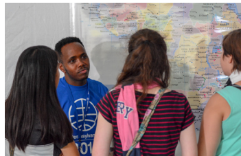
Découverte du travail de la CMM.

Promenez-vous dans les expositions où vous découvrirez les différentes cultures de la famille anabaptiste mondiale. Découvrez notre histoire, goûtez nos plats, chantez et dansez avec nous, écoutez des témoignages et partagez le vôtre !