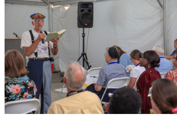
De nouveaux ateliers tous les jours.

Lors de l'Assemblée, vous pourrez discuter et échanger sur la paix et la justice, la jeunesse, la protection de la création, le baptême, le dialogue interreligieux, les ministères créatifs et bien plus ! Vous pouvez également proposer un sujet à mwc-cmm.org/A17ateliers si vous vous sentez appelé à faciliter un atelier virtuel ou présentiel.