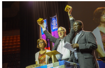
Pembicara internasional.

Pembicara Global, Paduan Suara Internasional Selama lima hari, jadilah bagian dari pengalaman ibadah multibudaya yang melibatkan paduan suara dan ansambel internasional, pembicara global, dan persekutuan yang benar-benar global. Daftar untuk terlibat di paduan suara internasional di mwc-cmm.org/choir .