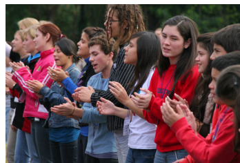
Program khusus untuk anak, remaja dan pemuda.

Anak-anak dan kaum muda memiliki tempat tersendiri di Temu Raya. Dari mengeksplorasi pesan-pesan Alkitab, musik yang menginspirasi, pembicara muda Anabaptis, kompetisi olahraga bersama, ada banyak kegiatan yang menyenangkan!