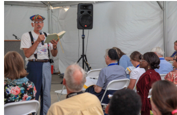
Hadiri lokakarya yang berbeda tiap hari.

Acara dalam Temu Raya juga menawarkan waktu untuk berdiskusi dan berbagi pengalaman seputar perdamaian dan keadilan, pemuda, lingkungan hidup, baptisan, dialog antaragama, pelayanan kreatif dan banyak lagi! Bila ada usulan topik lain atau Anda terpanggil untuk memimpin workshop virtual atau secara tatap muka, daftar ke mwc-cmm.org/AssemblyWorkshop .