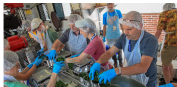
Kesempatan pelayanan bersama.

Pada siang hari kami menawarkan kesempatan bagi anda untuk belajar, berbagi, dan membangun persahabatan. Beragam kunjungan wisata, proyek pelayanan, dan aktivitas menyenangkan lainnya seperti turnamen sepak bola Piala Dunia Anabaptis disiapkan untuk Anda.